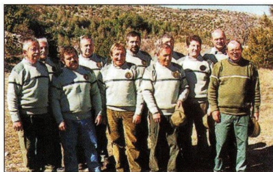
Les Louvetiers du Larzac

cochon. Il ne craignait rien de tout cela. Pourtant, un vieux bouquin du voisinage lui avait raconté que, certains jours, une meute de chiens et quelques hommes à pied l'avaient poursuivi très longtemps et que, pour s'échapper, il lui avait fallu utiliser toutes les ruses que la nature lui avait données ! Ce genre de chasse se serait reproduit plusieurs fois, paraît-il. Mais comment croire ces histoires que racontait ce vétéran, c'était l'âge sans doute qui le faisait radoter ces sornettes.