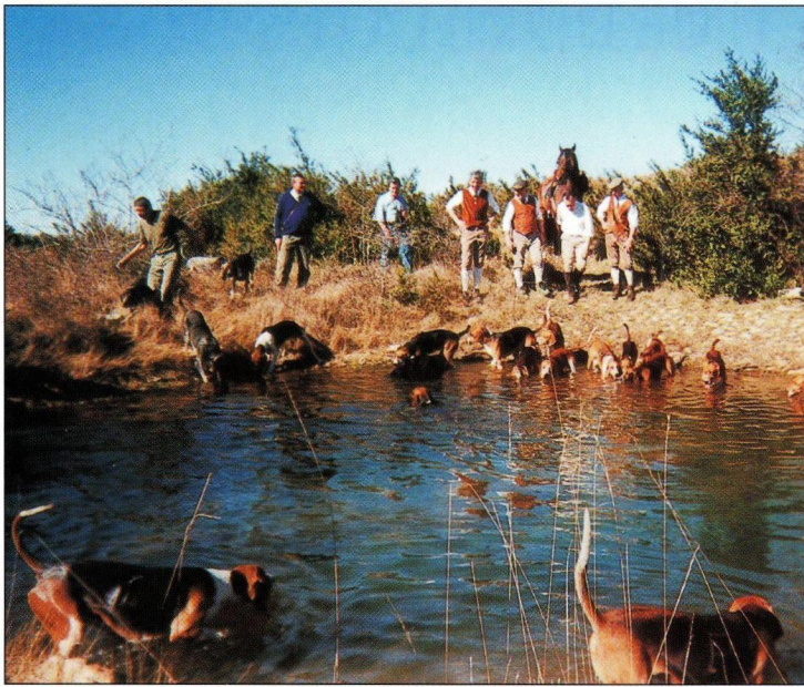
Le Caylar : sur le Causse du Larzac, les chiens ont besoin de boire

nous courions après ces lièvres depuis deux ans sans réussite. Ce souvenir reste gravé dans nos cœurs à tout jamais.